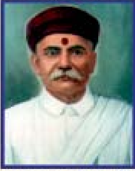
જીવહયા પ્રવૃત્તિના પિતામહ દયાલંકાર